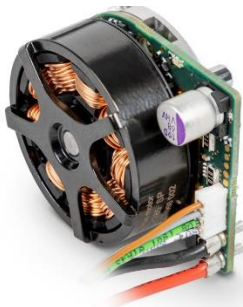
De nieuwe ECX FLAT 32 met geïntegreerde elektronica.